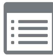
Outil de visualisation des journaux d'audit