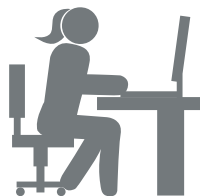
Station de double contrôle