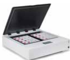
EyeC Proofer 400 - 600 DT