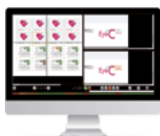
EyeC Proofer Content