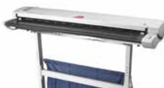
EyeC Proofer 900 - 1100 CS