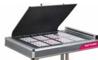
EyeC Proofer 900 - 1200 DT