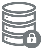
安全なデータベース