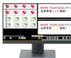
EyeC Proofer Graphic